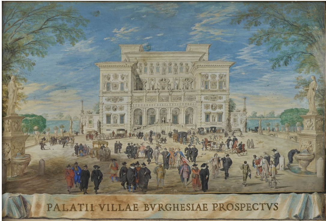
Prospetto del Palazzo di Villa Borghese, Johann Wilhelm Baur, 1636

Lo “status” della Villa Borghese era già stato decretato fin dalla sua nascita, quando il cardinal Scipione volle inserire sul prospetto della Galleria una iscrizione assai esplicita. Il “padrone” riferito nelle parole qui riportate, è oggi il Popolo Romano, ma il concetto rimane scolpito