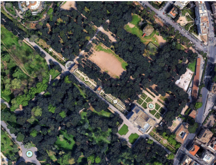
Foto area dell’attuale situazione

Le Associazione chiedono pertanto l’immediato ritiro del Bando di Gara recentemente disposto, concernente una possibile edificazione di nuovi edifici “contermini”, palesemente illegittimo.